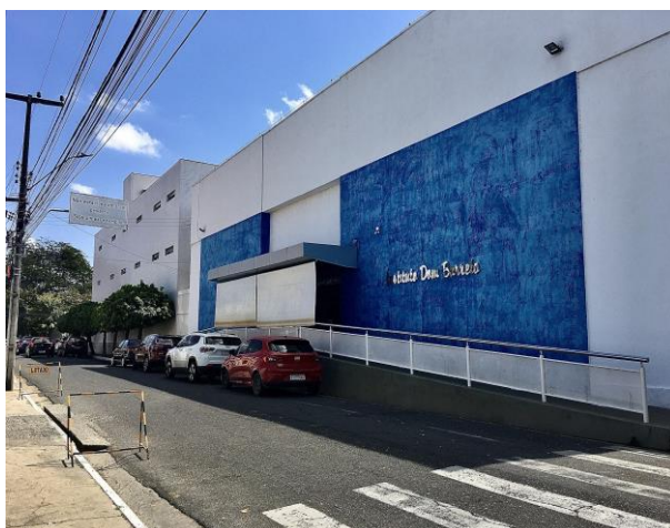
Fachada do colégio Instituto Dom Barreto, 31/08/2021, Teresina-PI, Rua 24 de janeiro

Como surgiu um dos ícones da educação piauiense e como ele vem se reinventando ao longo dos anos.