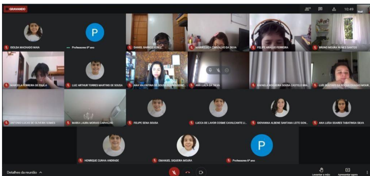
Print da tela durante a aula do 6º ano A no ano de 2021.