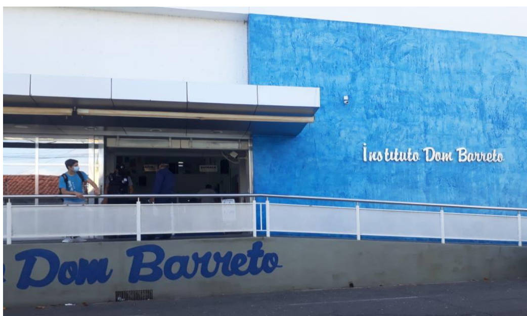
Fachada do colégio Instituto Dom Barreto TERESINA PI AV.Campos Sales Rua 24 de janeiro

Surge uma nova forma de ensino para resgatar a educação, depois de um ano de aulas on-line devido a pandemia.