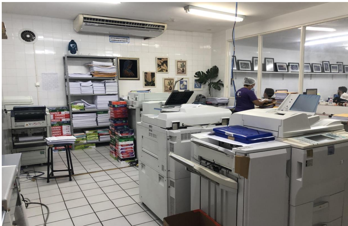
Setor de reprografia.

As fotocopiadas são materiais que os alunos usam diariamente na escola, sendo essenciais para o aprendizado das crianças por serem atividades de suporte para os alunos, porém apenas os funcionários da escola sabem como funcionam os processos de formação das fotocopiadas. Então, se vocês já tiveram curiosidade de saber como as atividades do Instituto Dom Barreto são feitas, vocês poderão descobrir como elas são produzidas e por quais setores passam com essa reportagem.