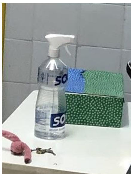
Álcool em gel do setor da reprografia.

Fotocopiadas que estão ensacadas para cumprir o “isolamento” de 72 horas.