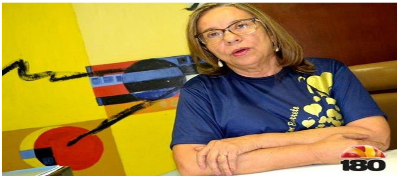
Exemplo de mulher empoderada que trabalha no IDB

Atualmente as mulheres exercem um papel importante na sociedade . E nas escolas isso não foi diferente , uma das escolas em que grande parte da coordenação é composta por mulheres é o Instituto Dom Barreto.